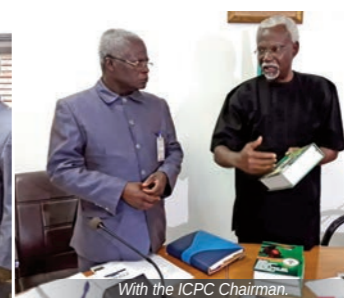
With the ICPC Chairman.