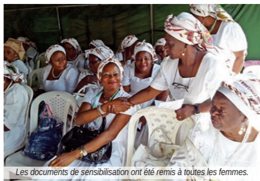
Les documents de sensibilisation ont été remis à toutes les femmes.