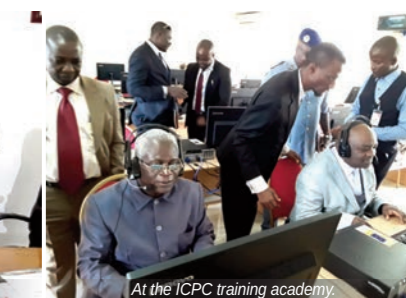
At the ICPC training academy.

high profile suspects and asset recovery, staff benchmark visits and formal partnership agreement with CONAC for information exchange and training of staff at the Academies of the two Commissions.