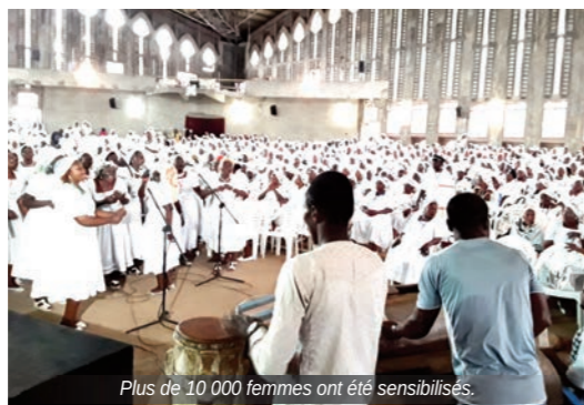
Plus de 10 000 femmes ont été sensibilisées.