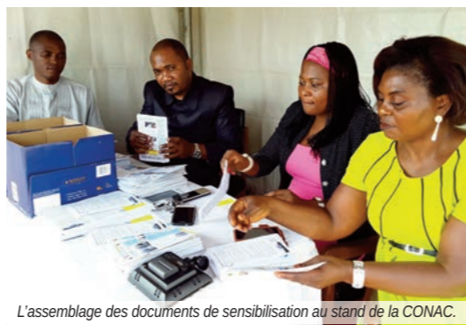
L'assemblage des documents de sensibilisation au stand de la CONAC.

dans la lutte contre la corruption. Pour conclure, le Président de la CONAC a proposé un certain nombre d'actions que les églises peuvent mener afin de mieux lutter contre la corruption. Il s'agit de :