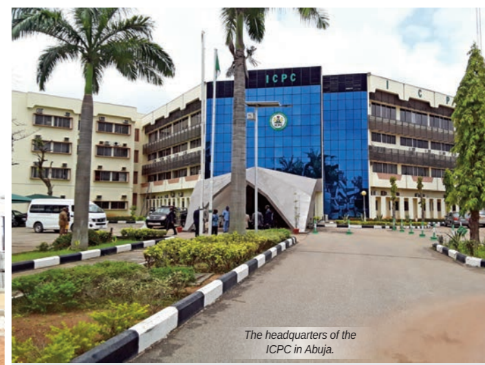
The headquarters of the ICPC in Abuja.

The Association of Anti-Corruption Agencies in Commonwealth Africa (AACACA), during its yearly meetings, encourages member countries to tap from each other's experience. Bench-marking visits are among the recommended actions that maximize the acquisition of knowledge, reinforce cooperation and pave the way for new achievements in fighting corruption.