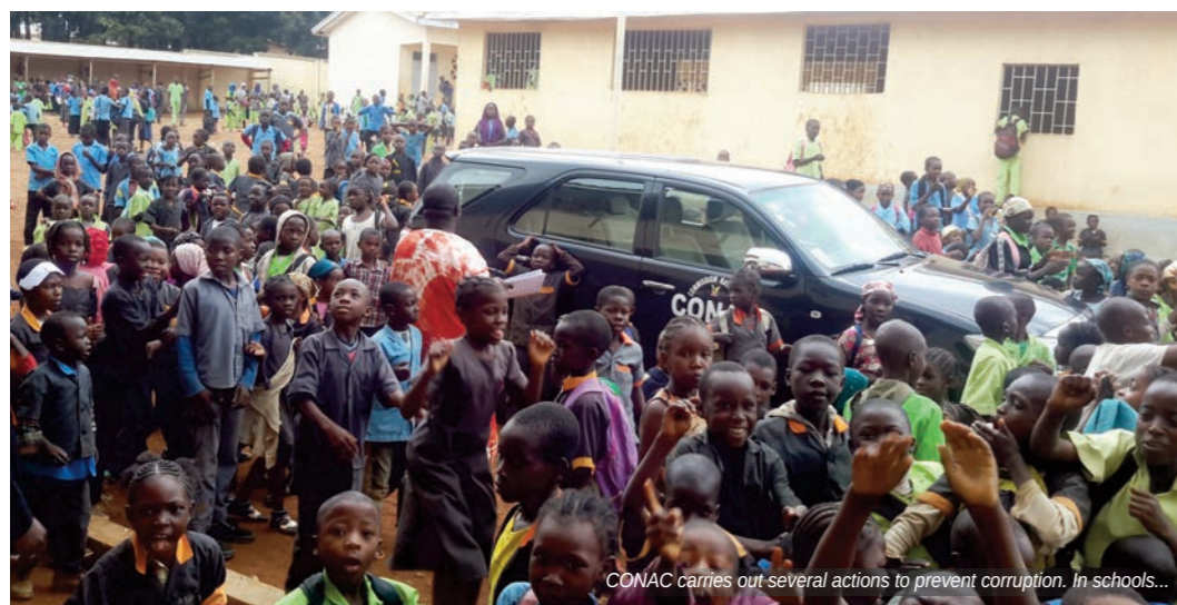
CONAC carries out several actions to prevent corruption. In schools...

A team of experts from Sierra Leone, Vanuatu and the United Nations Office on Drugs and Crime (UNODC) will be in Cameroon in the days ahead to evaluate efforts made by the country to prevent acts of corruption and recovery of the proceeds of corruption.