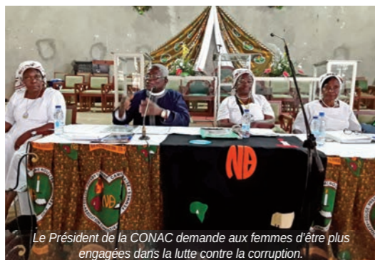
Le Président de la CONAC demande aux femmes d'être plus engagées dans la lutte contre la corruption.