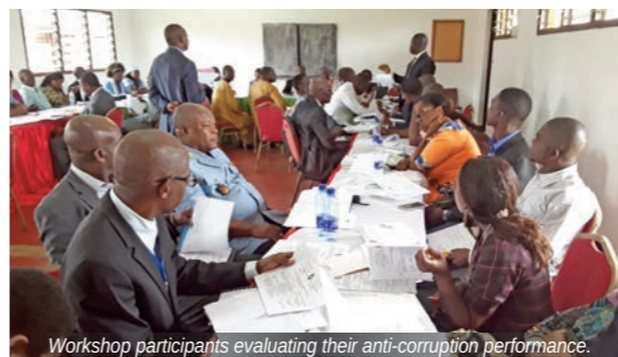
Workshop participants evaluating their anti-corruption performance.