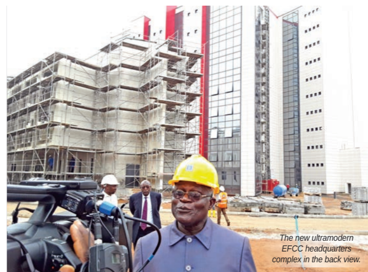
The new ultramodern EFCC headquarters complex in the back view.

A delegation of the National Anti-Corruption Commission was in Abuja from August 8 to 12, 2017, for a study visit to the Independent Corrupt Practices and Other Related Offences Commission (ICPC) and the Economic and Financial Crimes Commission (EFCC) of Nigeria.