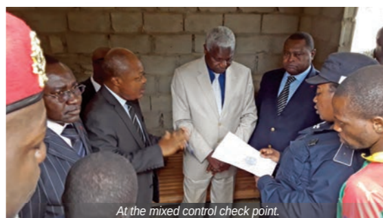
At the mixed control check point.

At the South Regional Treasury, the officials were asked to render the fight against corruption visible by pla-