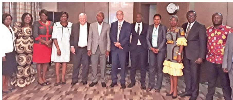
In 2018, the BCAC will focus on training and helping companies put in place ethics compliance codes of conduct.

The Steering and Executive Committees of the Business Coalition Against Corruption (BCAC) had a joint meeting on the 18th of January, 2018 to evaluate 2017 activities and map the way out for 2018. The 15 members who took part in the meeting, amongst them the representative of CONAC, lauded the efforts made by the BCAC to reinforce ethics and integrity in enterprises. 10 regional workshops were organized, during which some 229 persons were drilled on ethics com-