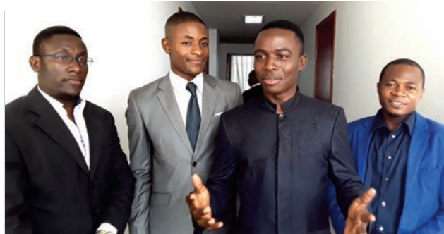
Bureau members of the UYI Integrity Club say they will create Focal Points in all Departments of the University.