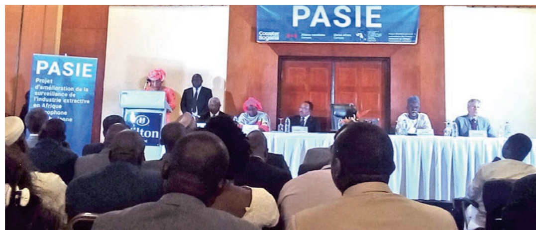
La participation de la CONAC y a été effective à travers son Président et de deux hauts cadres de cette Institution.