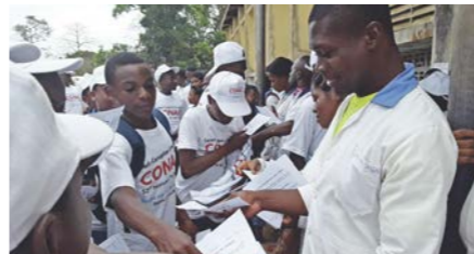
La mobilisation dans les établissements scolaires était particulière.