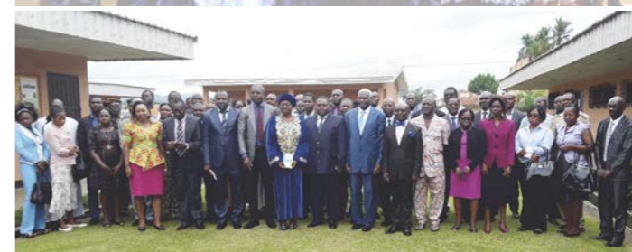
L'équipe qui a hissé la Région du Sud du 10ème au 5ème rang autour du Vice-Président de la CONAC.