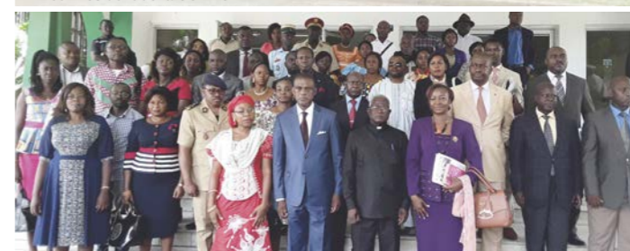
La Région du Littoral à la recherche d'un nouveau souffle.