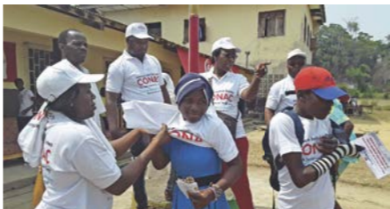
Les membres de la caravane ont distribué des messages de sensibilisation portés sur des T-shirts.