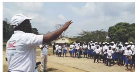
Des cérémonies de rassemblement spéciales ont été organisées.