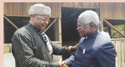
The traditional authorities of the South region have pledged their support in the fight against corruption.