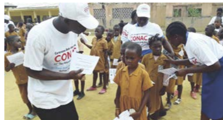
Des écoliers sensibilisés