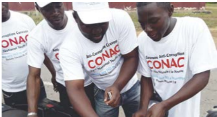
Des autocollants affichés