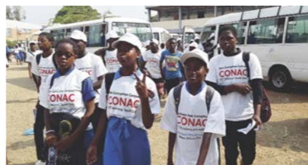
La caravane s'est déployée en deux itinéraires