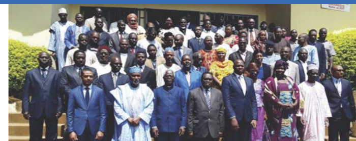
Les principaux acteurs de la lutte contre la corruption dans la Région de l'Adamaoua autour du Président de la CONAC.

De cette évaluation également, l'on peut