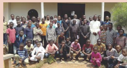
Students of the minor seminary were drilled on the role of the clergy in the fight against corruption.