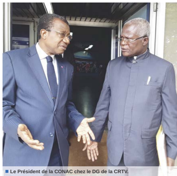
Le Président de la CONAC chez le DG de la CRTV.

Par ailleurs, la Commission Nationale Anti-Corruption organise beaucoup d'activités et ef-