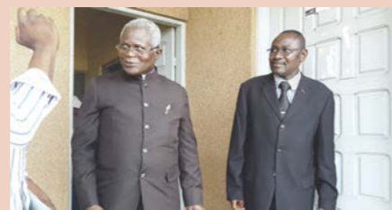
The scribe of the Ebolowa Urban council promised to reinforce good governance in his municipality.