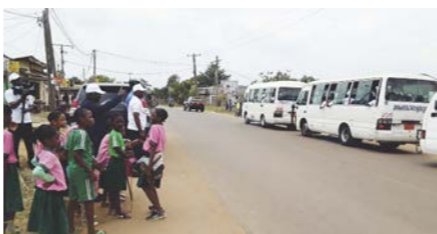
Départ de la caravane sous le regard du Président de la CONAC entouré de quelques écoliers.