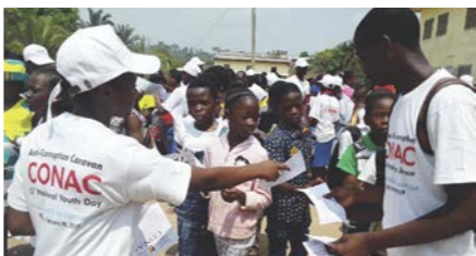
La CONAC a noté un enthousiasme particulier de la communauté éducative du sud.