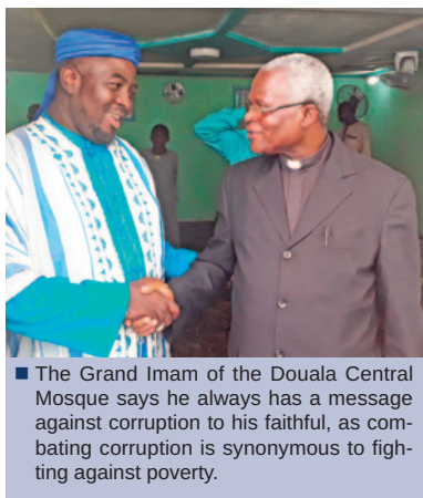
■ The Grand Imam of the Douala Central Mosque says he always has a message against corruption to his faithful, as combating corruption is synonymous to fighting against poverty.