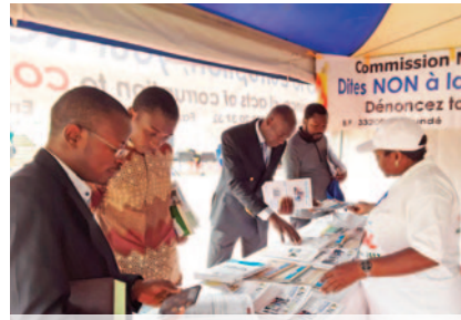
Distribution of documents and communication gadgets.