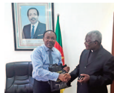
The Government Delegate to the Douala City Council, Dr Fritz NTONE NTONE, reassured the Chairman of CONAC that the fight against corruption will step up in Douala in the days ahead following the creation of an anti-corruption unit at the City Council.