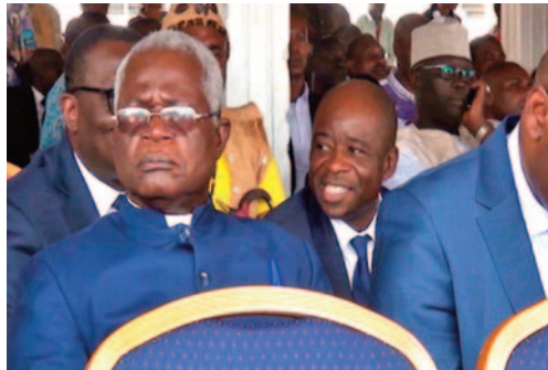
■ Le Président de la CONAC à la cérémonie d'ouverture du FENAC.