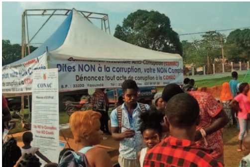
■ La CONAC a pris part au FENAC 2018 à Bertoua.

La Commission Nationale Anti-Corruption a pris part au 9e Festival National des Arts et de la Culture (FENAC) à Bertoua dans la Région de l'Est, du 16 au 24 juillet 2018. Ce fut l'occasion de sensibiliser les festivaliers et toutes les populations sur les dangers de la corruption qui freine l'essor du monde artistique et culturel.