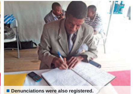
Denunciations were also registered.

The National Anti Corruption Commission, CONAC, continued its stride for a corruption-free Cameroon at the Government Action Forum, better known by its acronym SAGO, which held at Yaounde Multipurpose Sports Complex from the 24th to the 29th of July 2018.