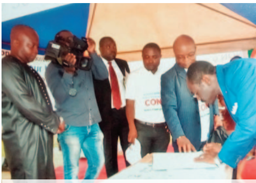
■ La signature du livre d'Or de la CONAC par le MINAC