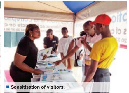
Sensitisation of visitors.