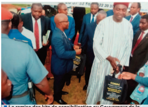
■ La remise des kits de sensibilisation au Gouverneur de la Région de l'Est.

La 9e édition du Festival National des Arts et de la Culture (FENAC), organisée par le Ministère des Arts et de la Culture, s'est déroulée du 16 au 22 juillet 2018 à Bertoua, Chef-lieu de la Région du Soleil-levant sous le thème : « Diversité culturelle, identité et unité nationale ». Il était placé sous le signe de la promotion du multiculturalisme et du vivre ensemble harmonieux, à travers les expressions artistiques et la diversité culturelle dans l'optique d'en faire un vivier important de la consolidation de l'unité nationale.