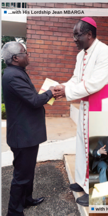
■ ...with His Lordship Jean MBARGA

The Chairman was received in audience by the Minister of State, Minister of Justice and Keeper of the Seals, Laurent ESSO. The wish of both dignitaries is that the Justice services should effectively play the role of last line defence to citizens in quest of justice.