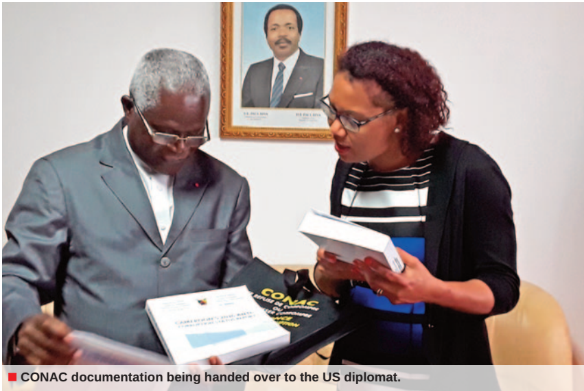
■ CONAC documentation being handed over to the US diplomat.

The American diplomat paid a courtesy call on the Chairman of CONAC on August 17, 2018.