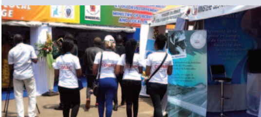
Les hôtesse de la CONAC à l'assaut des visiteurs.