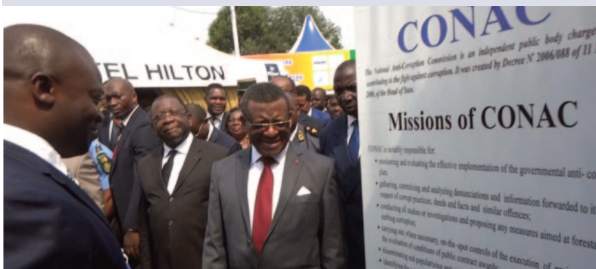
Le PM au stand de la CONAC.

La Commission Nationale Anti-Corruption, comme de tradition, a participé à la 7ème édition du Salon International de l'Entreprise, de la PME et du Partenariat, du 16 au 24 février 2019 à Yaoundé.