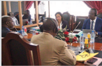
Echanges entre les experts onusiens et camerounais.

des membres de la société civile. Pour répondre aux questions des experts sur les mesures (lois, ordonnances, décrets, institutions) prises par le Cameroun pour satisfaire aux prescriptions de la Convention, ils ont puisé dans tous les textes juridiques applicables au Cameroun : la législation camerounaise, l'acte uniforme OHADA, le règlement CEMAC entre autres.