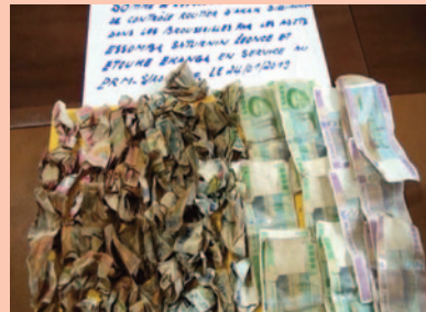
Classement et prise de photos du butin.

Les camionneurs trouvés sur les lieux en train de payer de l'argent aux Gendarmes, sans aucun reçu, expriment leur ras-le-bol. « On ne peut pas traverser sans payer