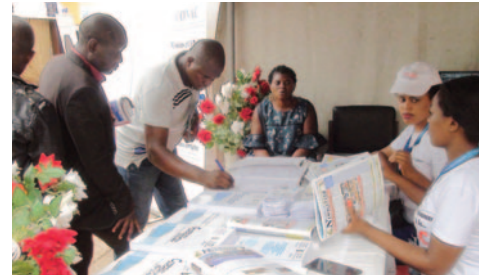
Some visitors left their feelings in the register of the event.

K nitted amongst other stands at the courtyard of the Yaounde Conference Centre, the stand occupied by the National Anti-Corruption Commission, CONAC, during the 7th edition of the International Trade Fair dubbed "PROMOTE", was a pool of attention.