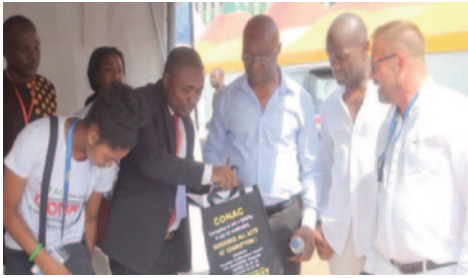
H.E. Roger MILLA at the CONAC stand.

Renowned personalities among others thronged the stand of CONAC that was open to visitors from the 16th to the 24th of February, 2019 at the International Trade Fair dubbed "PROMOTE".