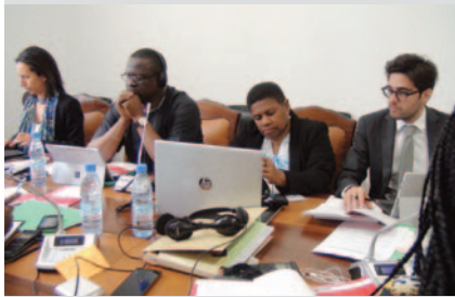
Les évaluateurs en séance de travail.