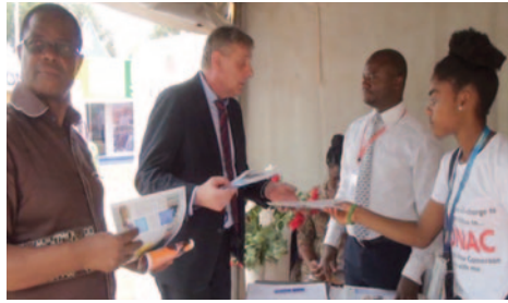
Several personalities visited the stand of CONAC.