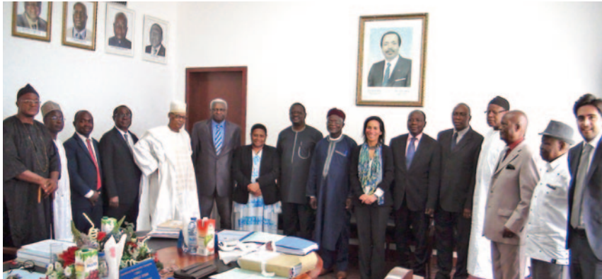
La Mission reçue par les membres du Comité de Coordination de la CONAC.

La voix du Cameroun, sur ce sujet, a été portée par des experts des domaines de la lutte contre la corruption (CONAC, ANIF), de la Justice et de la sécurité, ainsi que