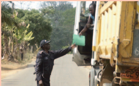
Contrôle routier à Monaté.

Une Action par voie d'Intervention Rapide (AIR) sur l'axe routier Yaoundé-Monaté à permis à la CONAC de saisir la somme de 255 000FCFA, issue de l'arnaque des automobilistes par des Gendarmes pris en flagrant délit, le 24 janvier 2019.