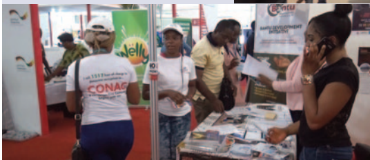
La sensibilisation dans d'autres stands.