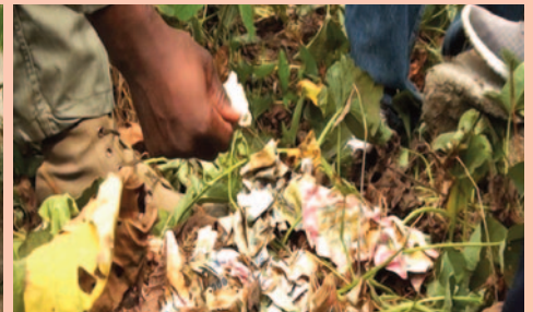
Découverte du forfait de l'arnaque en brousse.

La Mission de la CONAC s'apprête à se garer à un contrôle de Gendarmerie au lieu-dit AKAK près de NKOMETOU quand un Adjudant de Service prend immédiatement la fuite pour se réfugier dans la broussaille.