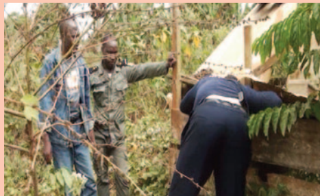
Fouille du butin caché en brousse.