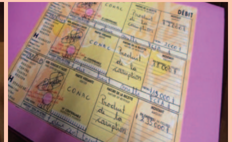
Quittance de versement au Trésor de l'argent saisi.

dans leurs poches », déclare l'un d'eux. « J'ai remis 5000 F pour qu'ils me remboursent 3000 F », ajoute un autre.