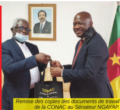
Remise des copies des documents de travail de la CONAC au Sénateur NGAYAP

L'organisation, par l'APNAC, d'un atelier d'information à l'endroit des Parlementaires et Sénateurs sur la ratification, par le Cameroun, de la Convention de l'Union Africaine sur la Prévention et la Lutte Contre la Corruption (CUAPLCC) était au centre des échanges entre les deux personnalités.