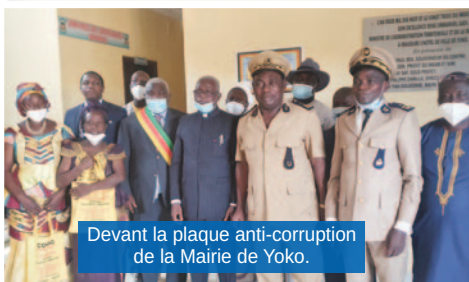
Devant la plaque anti-corruption de la Mairie de Yoko.