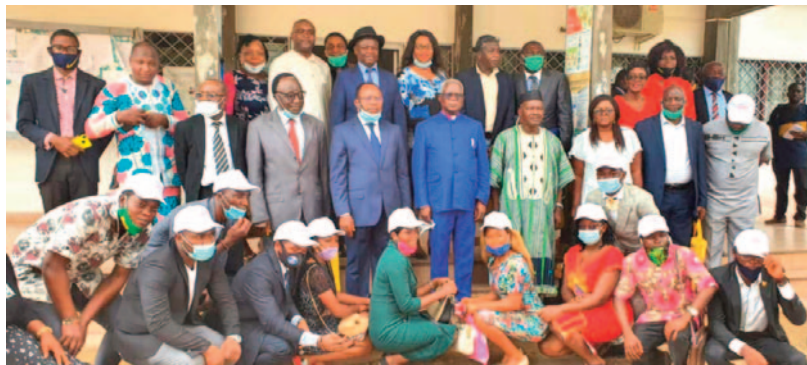
Group picture after the installation of the Integrity Club of the University of Buea.