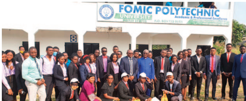
Group picture after the installation of the Integrity Club of FOMIC Polytechnic University, Buea.