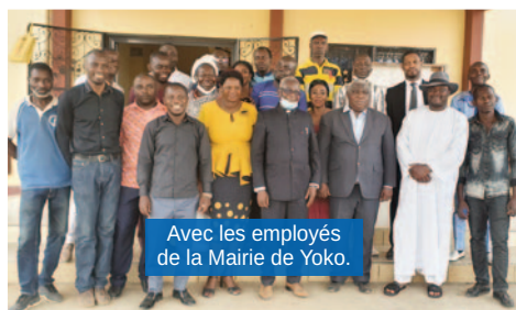
Avec les employés de la Mairie de Yoko.