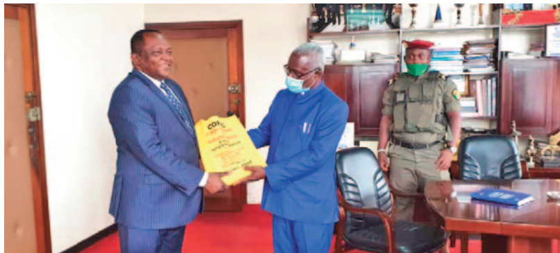
The Governor of the South West Region received anti-corruption gadgets from the Chairman of CONAC.

The Chairman of CONAC began his working visit in the South