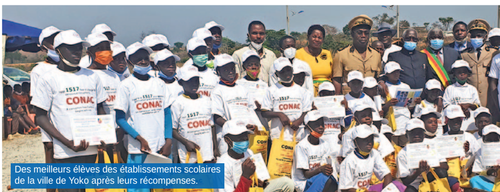
Des meilleurs élèves des établissements scolaires de la ville de Yoko après leurs récompenses.