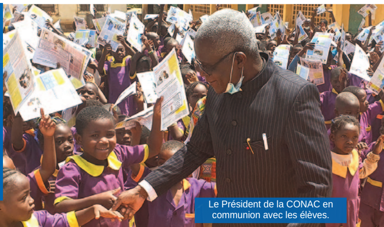
Le Président de la CONAC en communion avec les élèves.

Par la même occasion, la délégation de la CONAC a procédé à l'apposition des plaques anti-corruption de la CONAC, sur les façades des administrations publiques du Chef-lieu de l'Arrondissement de Yoko, dont la Sous-préfecture, la Mairie, l'hôpital de district, la prison principale, les établissements scolaires.