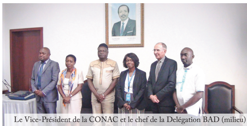
Le Vice-Président de la CONAC et le chef de la Délégation BAD (milieu)