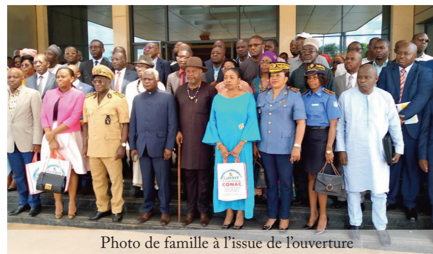
Photo de famille à l'issue de l'ouverture

Les échanges en vue de l'élaboration dudit plan d'actions ont fait une bonne place au partage d'expériences des 75 participants en matière de lutte contre la corruption et d'expression des attentes vis-à-vis de la CONAC. Par la suite, les experts de la CONAC ont entretenu les participants, venus principalement de Yaoundé, Douala Kribi et d'Ebolowa, sur des thématiques relatives aux méthodes et techniques de lutte contre la corruption ainsi