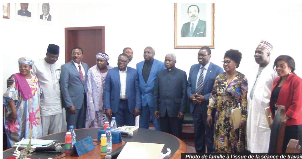
Photo de famille à l'issue de la séance de travail.