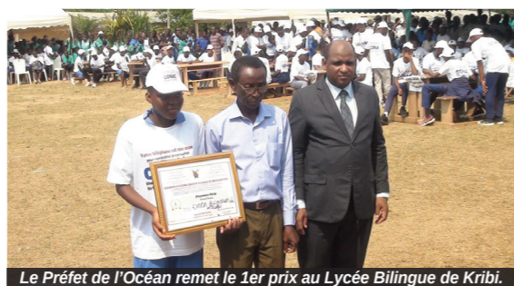
Le Préfet de l'Océan remet le 1er prix au Lycée Bilingue de Kribi.