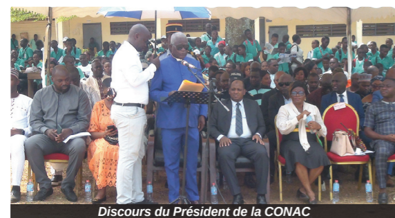
Discours du Président de la CONAC

Plusieurs activités ont été au menu de cette campagne parmi lesquelles des descentes dans les Etablissements publics et privés de la ville en vue de la mise en place des Clubs d'intégrité ainsi que la sensibilisation dans les Etablissements déjà dotés de ces structures ; des échanges et des entretiens avec certains responsables de la Communauté éducative tels que les Chefs d'établissements, les Enseignants, les élèves, les Responsables des Instituts et structures de formation professionnelle de la Jeunesse (Enieg, Cenajes). Onze établissements ont été visités et des flyers de sensibilisation, distribués.