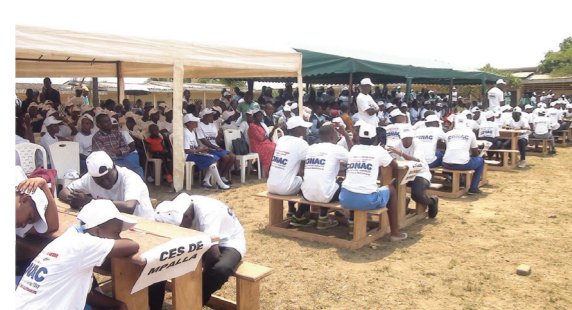
Déroulement de la compétition.