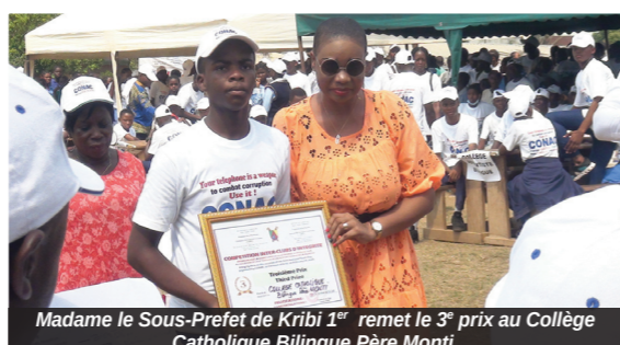
Madame le Sous-Prefet de Kribi 1er remet le 3e prix au Collège Catholique Bilingue Père Monti.