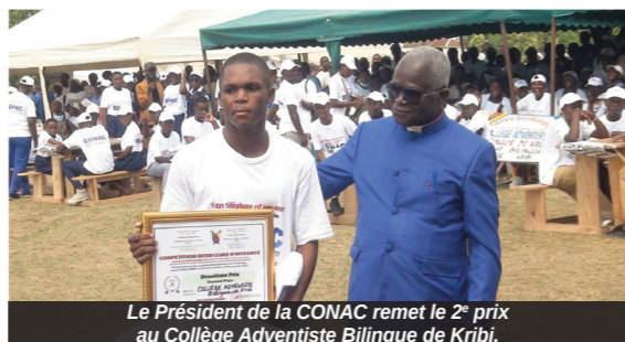
Le Président de la CONAC remet le 2e prix au Collège Adventiste Bilingue de Kribi.