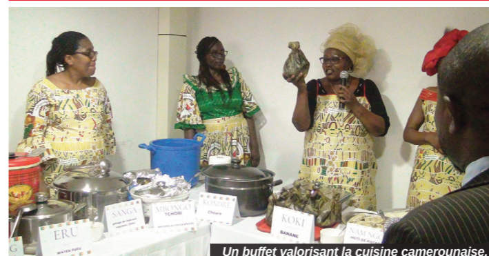
Un buffet valorisant la cuisine camerounaise.

Les femmes de la Commission Nationale Anti-Corruption (CONAC) ont opté pour un buffet traditionnel très varié pour marquer la Journée dédiée aux droits de la femme.