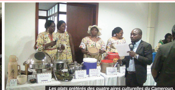
Les plats préférés des quatre aires culturelles du Cameroun.

La célébration de la Journée internationale de la femme, le 8 mars 2023, à la CONAC, s'est achevée autour d'un buffet valorisant la cuisine camerounaise. Une innovation qui a permis aux femmes de la CONAC d'offrir au personnel de l'Institution les plats préférés des quatre aires culturelles du Cameroun : le Grand Nord-Cameroun (aire Soudano-Sahélienne), l'Est, le