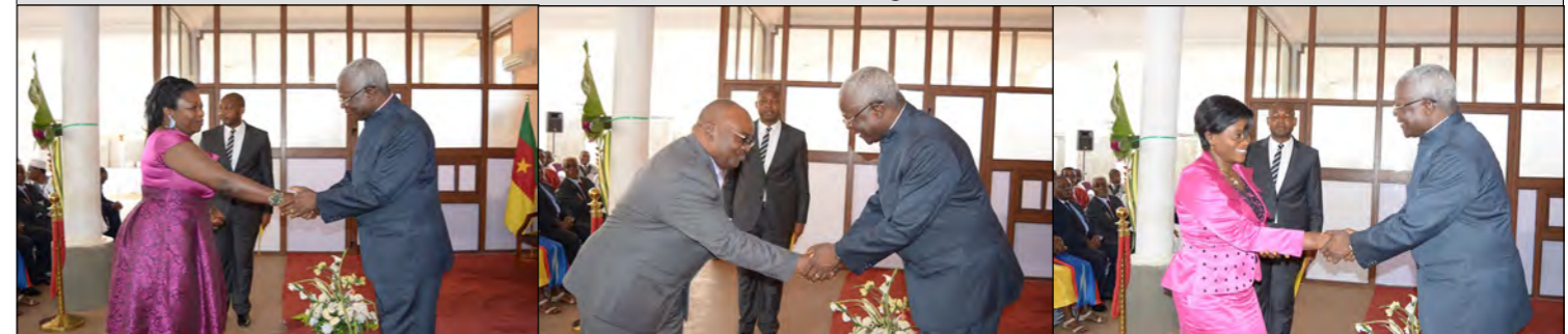
Mme le Chef de Division des Investigations