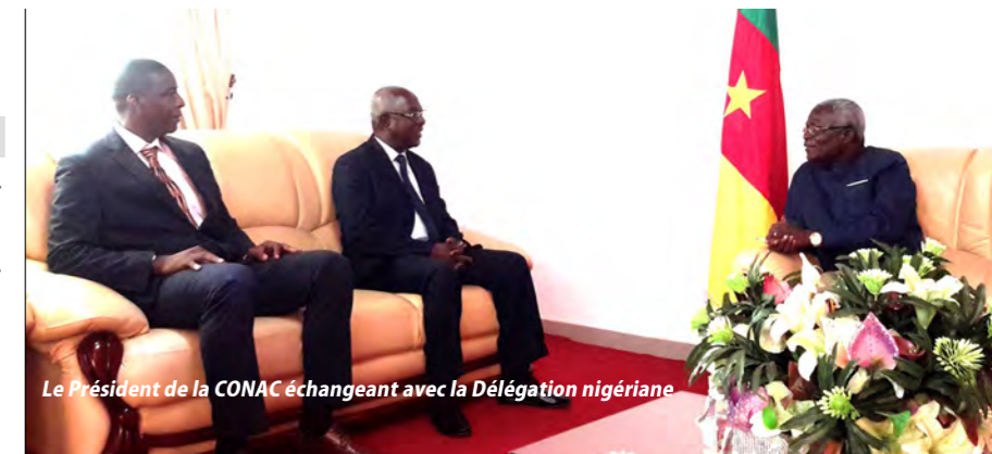
Le Président de la CONAC échangeant avec la Délégation nigérienne