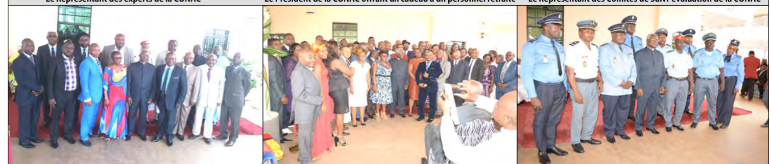
Photo de famille avec les experts de la CONAC