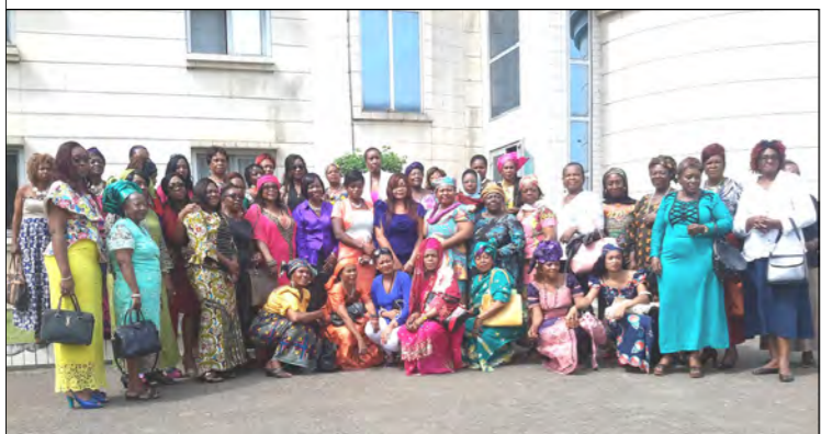
Group Picture at the end of the training