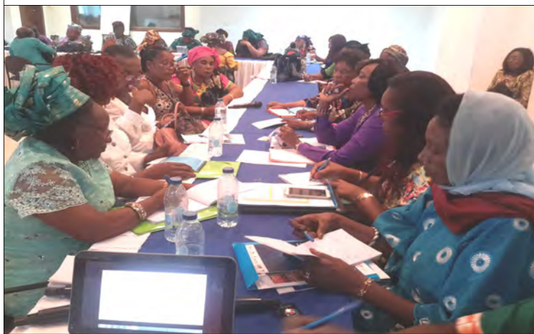
Business women during the workshop

The National Anti-Corruption Commission of Cameroon (CONAC) during two separate events in January 2017 in Douala, offered training to business women and the staff of the electricity distribution company, Energy Of Cameroon (ENEO).