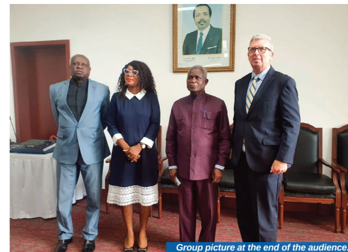
Group picture at the end of the audience.

The aim was to take stock of the technical needs of the National Anti-Corruption Commission which fall in line with the preliminary phase of the Technical Assistance Project, that consists of an exhaustive evaluation of the needs of actors implicated in