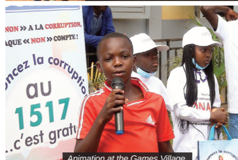
Animation at the Games Village.