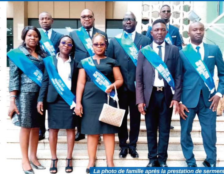
La photo de famille après la prestation de serment.

La cérémonie s'est achevée par une photo de famille.