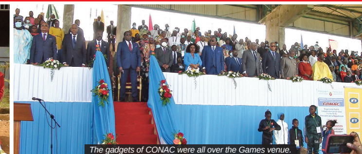
The gadgets of CONAC were all over the Games venue.