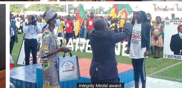
Integrity Medal award.