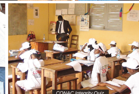
CONAC Integrity Quiz.