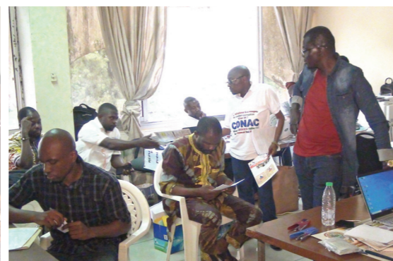
Busy round the clock