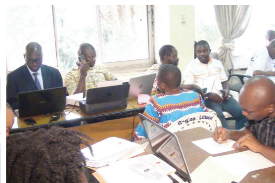
Over 350 denunciations received