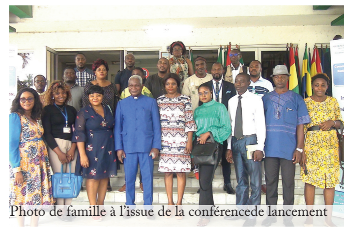
Photo de famille à l'issue de la conférence de lancement

Une « Clinique Anti-Corruption » est une activité de rapprochement de l'Institution de lutte contre la corruption au Cameroun des citoyens. Pour marquer la 20 e édition de la Journée internationale de lutte contre la corruption célébrée sous le thème : « 20 ans de la Convention des Nations Unies contre la Corruption : unissons le monde contre la corruption », la Commission Nationale Anti-Corruption a décidé d'ausculter la ville de Douala et sa population. Cela s'est traduit par la délocalisation des services de la CONAC dans la ville de Douala, afin de résoudre en temps réel les problèmes de corruption qui lui sont présentés.