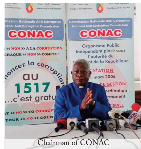
Chairman of CONAC

“...On the 9th of December, 2022, Cameroon will join the international community to celebrate the International Anti-Corruption Day. The theme chosen by the United Nations for this 2022 edition is: “United Nations Convention against Corruption at 20: Uniting the World against Corruption”. This theme is a call to all stakeholders and citizens at various levels to pull their efforts to combat corruption. Corruption, it must be emphasized, affects all sectors of society, as it undermines the ability of States, such as ours, to promote harmonious and efficient development. In response to this invitation, and in view of getting more citizens involved in this fight, the National Anti-Corruption Commission deliberately chose the city of Douala to host the activi-