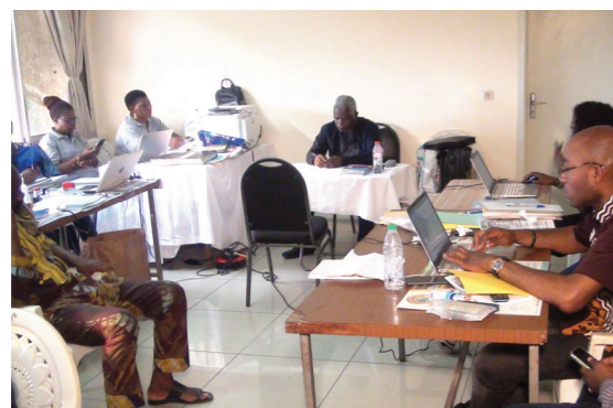
CONAC staff at work