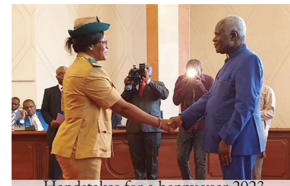
Handshakes for a happy year 2023

The CONAC boss reassured workers that measures are