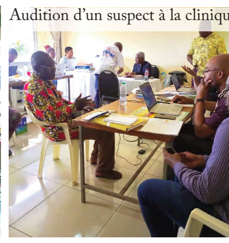
Audition d'un suspect à la clinique

Cette activité a commencé par une Conférence de presse donnée par le Président de la CONAC, le Révérend Docteur Dieudonné MASSI GAMS, en vue d'inviter les personnes confrontées à des problèmes de corruption à prendre l'attache de la CONAC. Tous les canaux de dénonciation de la CONAC ont servi à recueillir les plaintes des citoyens victimes ou témoins d'actes de corruption dans cette localité. Au total, 365 dénonciations de divers actes de corruption ont été reçues à la clinique, dans les Services du Gouverneur. Ces dénonciations concernaient des cas de violation du Code des Marchés Publics, d'usurpation de fonction et trafic d'influence, de refus de service dû, d'extorsion d'argent et de faux en matière d'immatriculation de voiture et d'obtention de permis de conduire B, de vente