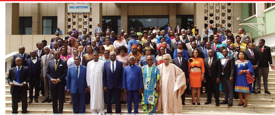
United against Corruption

Nous soulignons, entre autres, que le Chef de l'Etat, Son Excellence Paul BIYA n'a pas seulement créé la CONAC, mais sa volonté d'éradiquer la corruption de la société camerounaise se manifeste davantage. Son discours à la Nation le 31 décembre 2022 le témoigne à suffisance.