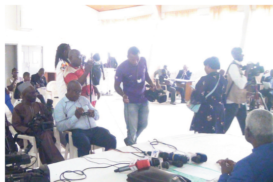
Journalists answered present